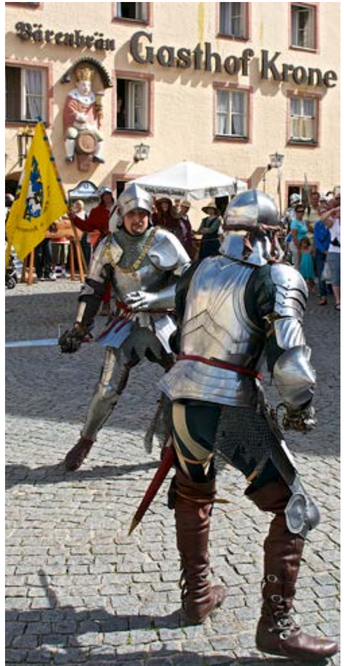
Kaiser Maximilian 1. Festumzüge, Füssen